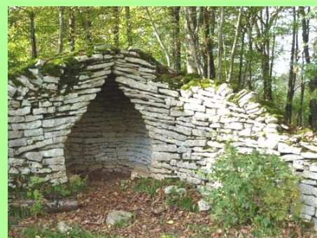
Pays lédonien : cabane de berger.

Pour Jean Nouvel : « les territoires ne sont plus des terres vierges à conquérir. Comme les ressources, ils sont en quantité finie. Il faut les préserver, ce qui ne veut pas dire nécessairement les conserver. Il faut comprendre (...) ce qu'ils ont de particulier et d'irremplaçable (...) et ensuite se demander comment les faire évoluer ».