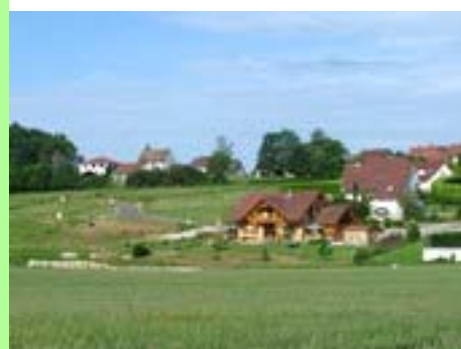
Pays lédonien : l'urbanisation.

Parallèlement, le nombre de résidences secondaires et celui des logements vacants ont été multipliés respectivement par 3 et par 2,5 entre 1962 et 2008.