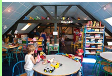
Ludothèque du Grand Dole. Prêt : « Grand Dole ».