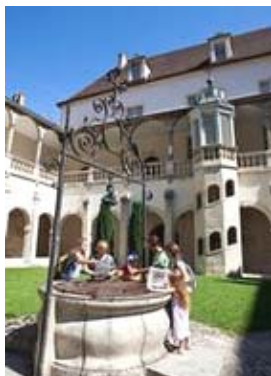
Dole : la médiathèque.

Un projet de développement durable doit se traduire par des règles, en particulier en matière d'urbanisme et de consommation de l'espace, mais il doit aussi produire de l'attractivité. Il doit également éviter l'écueil de l'abstraction. Il est certes nécessaire d'imaginer le devenir du territoire à l'horizon 2025, mais il est aussi essentiel de gérer le quotidien.