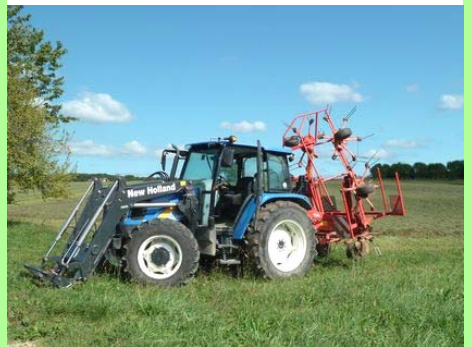
Pays lédonien : l'agriculture.

Il n'est pas toujours simple pour un conseil municipal d'admettre que les terres agricoles doivent être préservées, alors que les prairies qui bordent le bâti existant semblent s'étendre à l'infini. Il n'est pas facile pour un maire d'entendre un tel discours, lorsqu'il s'est engagé à réaliser un projet de lotissement ou de zone d'activités.