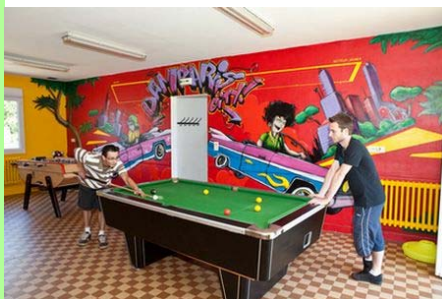
Damparis : espace jeunesse.

Les progrès en matière d'hygiène de vie et de santé dans l'hémisphère nord, et la forte natalité dans l'hémisphère sud, notamment dans l'Afrique subsaharienne, expliquent en grande partie cette croissance. Selon les prévisions, alors que l'hémisphère nord tend à atteindre son équilibre démographique, la population mondiale devrait encore augmenter pour se stabiliser entre 9 et 10 milliards d'individus à la fin du XXI ème siècle.