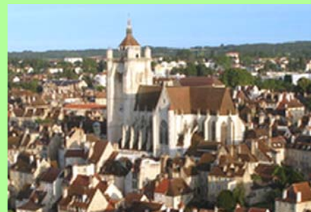
Dole : la collégiale (2) .

Le choix de la date n'est pas un hasard, car le parc technologique tout neuf fait désormais partie de notre patrimoine commun.