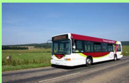
Transports en commun.

Pour reprendre l'exemple des transports en commun que j'évoquais précédemment, le PADD a mis en évidence l'existence d'un axe majeur Tavaux-Damparis-Choisey-Dole-Brevans, qui structure très fortement notre agglomération. L'organisation de notre réseau de bus a pris en compte par conséquent ce constat. La liaison cadencée Tavaux-Brevans permet ainsi de desservir l'essentiel non seulement de la population, mais aussi des services (l'hôpital, les lycées, les grandes surfaces,...), et des entreprises de notre territoire.