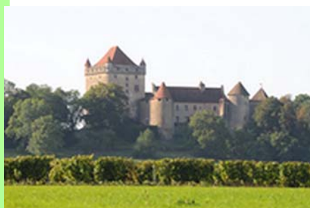
Pays lédonien : le château du Pin.

Aucun territoire n'est donné mais il est construit socialement. Il est le fruit des interactions entre l'homme et son environnement (terroir, climat,...).