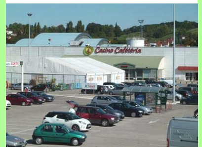
Lons-le-Saunier : Géant Casino.

Ce mode de développement est-il, aujourd'hui, encore soutenable ? Les effets collatéraux de cette dynamique ne sont pas négligeables.