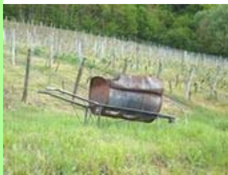
Pays lédonien : le vignoble.

Au-delà du périmètre qui sera retenu, il me semble enfin crucial de s'intéresser aux secteurs limitrophes qui ne seront pas concernés par un schéma de cohérence territoriale.