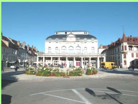
Lons-le-Saunier : le théâtre.

Le syndicat mixte doit être une instance de concertation permettant à l'ensemble des élus d'examiner les projets de Plans Locaux d'Urbanisme (PLU), de cartes communales, de lotissements,..., concernant le territoire.