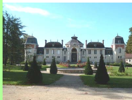
Lons-le-Saunier : les thermes.

Les sommes que nous percevons sont modestes, en comparaison de celles qui sont collectées par des structures similaires à la nôtre.