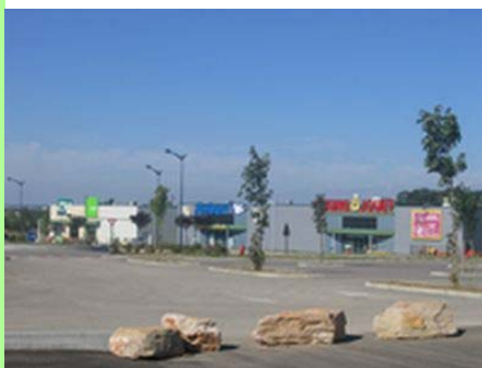
Choisey : zone commerciale.

Enfin, pour que notre SCoT soit conforme aux dispositions de la loi « Grenelle 2 », il ne nous restera plus qu'à élaborer un Document d'Aménagement Commercial (DAC). Nous allons créer une instance qui réunira l'ensemble des acteurs concernés par ce sujet, afin de travailler ensemble à un développement harmonieux de notre territoire.