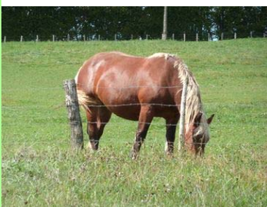
Pays lédonien : l'agriculture.

Littéralement, on pourrait traduire le SCoT comme étant la présentation des grandes lignes d'une organisation logique et harmonieuse d'un espace occupé par des hommes, et plus largement par des êtres vivants.