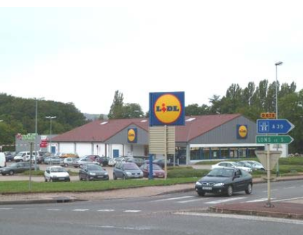
Perrigny : zone commerciale.

Dans ces communes et à l'intérieur des zones à urbaniser ouvertes à l'urbanisation après l'entrée en vigueur de la loi urbanisme et habitat du 2 juillet 2003, il ne peut pas être délivré d'autorisation d'exploitation commerciale en application de l'article L. 752-1 du Code du commerce, ou d'autorisation prévue aux articles L. 212-7 et L. 212-8 du Code du cinéma et de l'image animée.