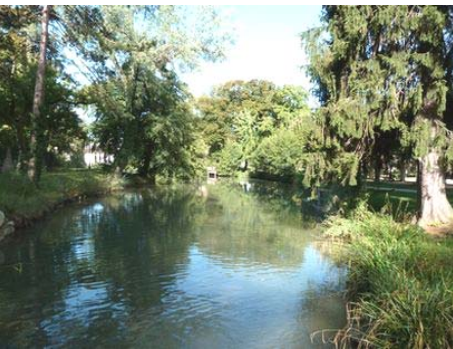
Lons-le-Saunier : le Parc des Bains.

Je n'en citerai qu'un seul : la concertation. Un SCoT n'a de sens que s'il est accepté par les élus et par la population, qui doivent se l'approprier. Dans le cas contraire, vous ne pourrez pas le mettre en œuvre. Je ne veux pas désespérer ceux qui rédigent les documents et les diffusent. Ce travail est indispensable, mais il n'est pas suffisant.