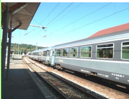
Lons-le-Saunier : la gare.

Chacun doit comprendre que les wagons ont besoin de la locomotive et réciproquement. Pour poursuivre avec cette métaphore ferroviaire, si la motrice est en panne, c'est l'ensemble du convoi qui reste à quai.