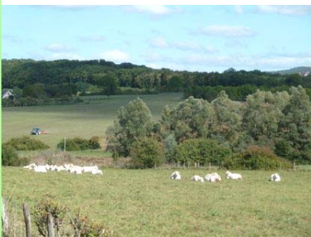
Pays lédonien : l'agriculture.

Pour chaque commune concernée par le SCoT, je disposais ainsi de données précises. Celles-ci m'ont permis de démontrer à quelques maires vindicatifs que le schéma de cohérence territoriale n'était pas coercitif, mais qu'il était au contraire un outil favorisant un développement raisonné et donc harmonieux du monde rural.