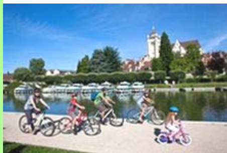
Dole : les quais du Doubs. © Studio Vision. Prêt : « Grand Dole ».

Mais nous sommes confrontés à deux échelles de temps très différentes. Le Grand Dole a été créé en six mois, alors que plusieurs années sont nécessaires pour élaborer un SCoT.