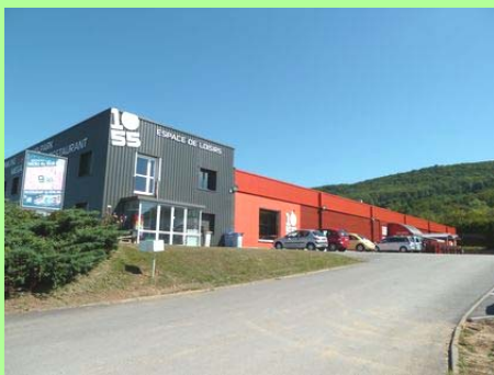
Perrigny : zone d'activités.

Le droit de l'urbanisme reposait alors sur le principe d'équilibre entre l'aménagement et la protection des territoires. Mais, souvent qualifié de « super-POS » en raison de son caractère trop précis, de la lourdeur de son élaboration, de l'absence de suivi et de gestion aboutissant à son obsolescence et à un mauvais encadrement des POS, le schéma directeur était appelé à disparaître.