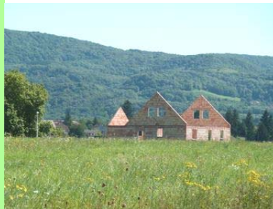
Pays lédonien : le mitage.

voire une baisse de leur démographie. En effet, la population des pôles de 1 000 à 2 000 habitants n'a augmenté que de 5%, alors que celles des communes de plus de 2 000 habitants a régressé de 2%.