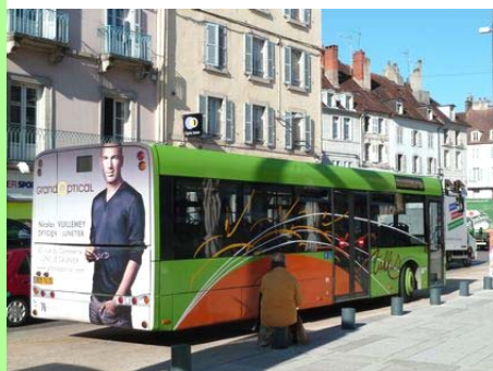
Transports en commun.

Nous pouvons ainsi tirer les leçons de leurs succès et de leurs échecs, obtenir des informations, des documents, un appui méthodologique,... Je crois beaucoup aux collaborations de ce type.