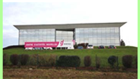
« Grand Dole » : centre d'activités nouvelles.

Le document sera ensuite révisé pour intégrer les dispositions de la loi « Grenelle 2 » avant le 1 er janvier 2016.