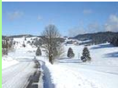
PNR du Haut-Jura : Les Moussières.

(9) Le Parc Naturel Régional (PNR) du Haut-Jura s'étend sur 3 départements (Ain, Doubs et Jura). Le Pays de Gex étant déjà couvert par un SCoT, le futur SCoT devrait concerner la quasi-totalité des communes du Jura situées dans le PNR et quelques communes du Doubs.