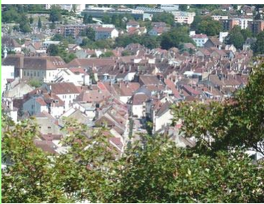
Lons-le-Saunier : centre-ville.

Durant les trente dernières années, la dynamique territoriale dans le Jura, comme dans d'autres départements à dominante rurale, a sensiblement évolué. Les renversements de tendance sont très nets. La désertification des zones très rurales a été largement enrayée et ces secteurs sont aujourd'hui en progression démographique. Entre 1998 et 2008, la population des villages de moins de 100 habitants a augmenté de 7%, celles des communes de 100 à 200 habitants de 10%, et celles des communes de 200 à 1 000 habitants de 9%.