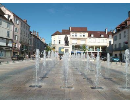
Lons-le-Saunier : place de la Liberté.

Le premier enjeu pour nous est d'affirmer notre identité et d'exister à côté de ces voisins influents.