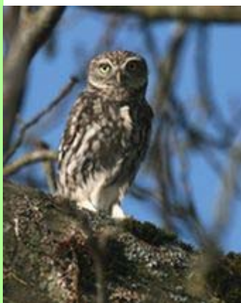
Chouette chevêche. © Jean-Philippe Paul (LPO).

Il s'agit d'un acquis précieux, car il a inspiré l'ensemble de nos politiques.