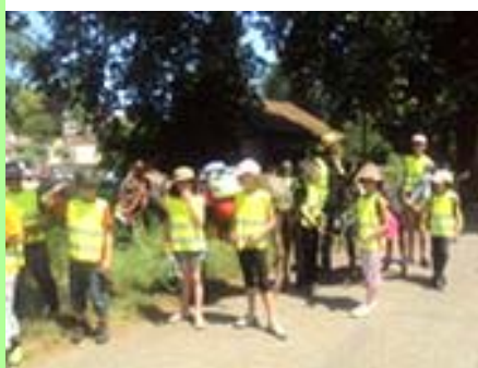
« Grand Dole » : randonnée.

En France métropolitaine, la population s'établit à un peu moins de 30 millions d'habitants en 1800, un peu plus de 45 millions en 1960, près de 56 millions en 1987, pour environ 63 millions aujourd'hui.