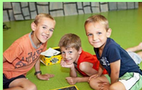
Ludothèque du Grand Dole.

Travailler demain à la révision de notre SCoT dont le périmètre aura été préalablement élargi, nous conduira à nous interroger sur la meilleure manière de vivre ensemble. L'enjeu sera notamment d'identifier les secteurs qui seront amenés à se développer.