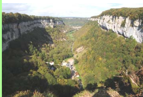
Reculée de Baume-les-Messieurs. © Raymond Michaud.

Il s'agit notamment d'améliorer l'attractivité de notre territoire, en préservant notre environnement en général et nos paysages en particulier, car ils constituent l'un de nos atouts majeurs. Je ne reviendrai pas sur ce sujet, car vous l'avez déjà largement évoqué dans les précédents numéros de votre journal.