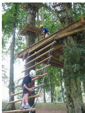
Crissey : « accrobranche ». © Prêt : « Grand Dole ».

Ces dispositions sont capitales, car les villages de la deuxième et de la troisième « couronnes » ont désormais intérêt à nous rejoindre et à adhérer à notre projet de territoire, s'ils veulent échapper à la constructibilité limitée.