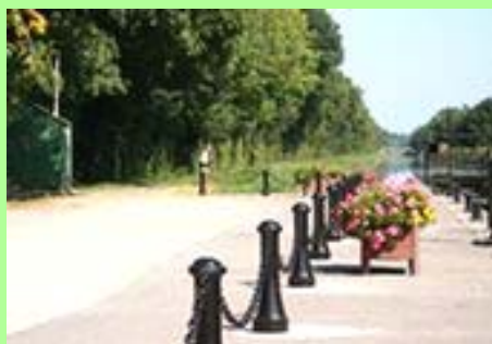
Audelange : la veloroute.

En outre, les limites retenues ne sont pas pertinentes, j'aurai l'occasion de revenir sur ce point.