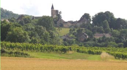
Maynal. © Raymond Michaud.

Je n'ai aucun a priori à propos du périmètre de notre futur SCoT « Grenelle », qui pourrait être élargi, mais aussi restreint. Tout est envisageable et nous devons réfléchir sans aucun tabou. Nous nous affranchirons peut-être des limites des structures intercommunales, voire de celles du département.