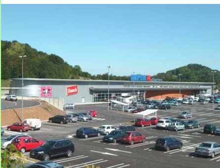
Montmorot : zone commerciale.

Les grandes zones localisées aux entrées de l'agglomération ont en outre un impact non négligeable sur les paysages et sur le cadre de vie, voire sur l'image du Pays lédonien dans son ensemble.