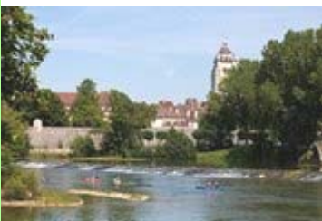
La ville de Dole.

La proximité de ces deux grandes villes a bien évidemment des incidences sur le quotidien des habitants de notre territoire, mais aussi sur les perspectives de développement de celui-ci, j'aurai l'occasion de vous en reparler.