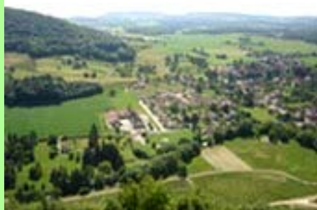
La consommation de l'espace.

monieux à la fois des communes urbaines et rurales. Les règles retenues dans notre SCoT en matière d'urbanisme en témoignent. Leur efficacité a été validée par deux études particulièrement intéressantes et utiles. Elles ont été réalisées par vos services, j'aurai l'occasion d'en reparler.