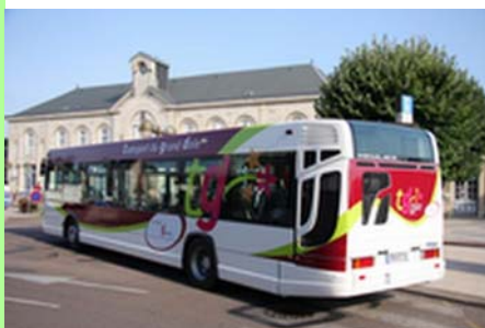
Transports en commun.

En raison de l'augmentation régulière des prix des carburants, c'est en effet uniquement en mettant des transports collectifs à la disposition de la population que nous permettrons demain, à ceux qui le souhaitent, d'habiter un peu plus loin de la ville-centre.