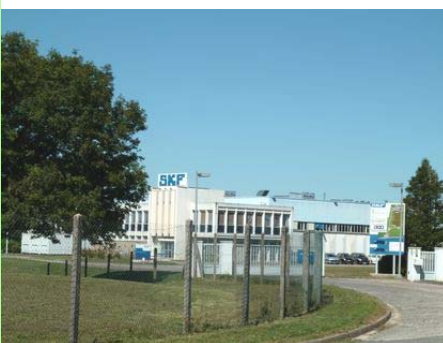
Perrigny : zone d'activités.

Un espace, quel qu'il soit, peut être concerné par une multitude de documents : schéma directeur, Plan Local d'Urbanisme (PLU) ou carte communale, Programme Local de l'Habitat (PLH), Plan de Déplacements Urbains (PDU), schéma de développement commercial,... Chacun d'eux est élaboré par une institution ou un organisme distinct, sans que des liens forts existent entre ces documents.