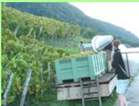
Château-Chalon : les vendanges.