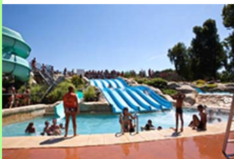
Dole : l'Aquaparc.

Une agglomération comme la nôtre n'est pas comparable à celle de Lyon ou de Dijon. Parce qu'elle est à la fois urbaine et rurale, elle est un espace de décisions politiques qui n'est pas loin d'atteindre ses limites géographiques. Elle ne pourra s'étendre indéfiniment. Il faudra sans doute inventer d'autres modes de gouvernance. J'ai saisi l'Association Des Communautés de France (ADCF) à ce propos, et ce sujet devrait être évoqué lors de sa prochaine convention.