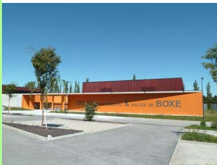
Lons-le-Saunier : le dojo.

Le document a été soumis à enquête publique du 5 septembre au 17 octobre 2011 et son approbation devrait intervenir au début de l'année 2012.