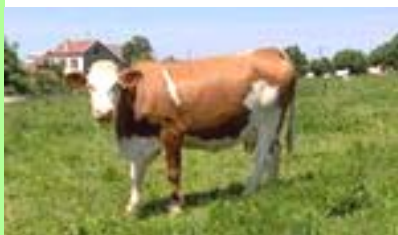
Agriculture et habitat.

des Sols (POS), nécessite une certaine stabilité pour un minimum de sécurité juridique.