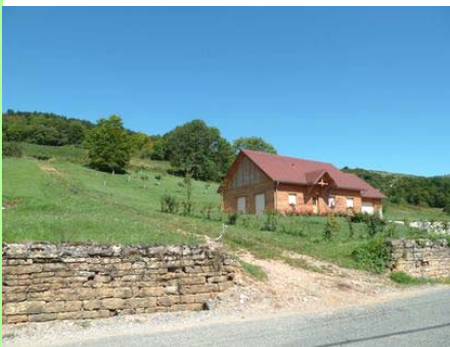
Pays lédonien : le mitage.

Je dis paradoxalement, car l'objet d'une consommation frugale de l'espace est précisément de contribuer à un développement durable de nos villages.