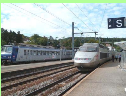
Lons-le-Saunier : la gare.