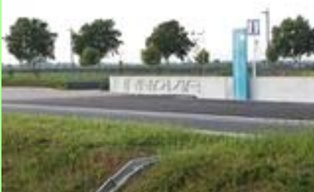
Le pôle « Innovia ».

À terme, nous espérons disposer d'une nouvelle gare TGV desservie par la branche sud de la Ligne à Grande Vitesse (LGV) Rhin-Rhône.