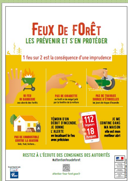
Affiche de la campagne nationale - 2019

Si nécessaire, prise d'arrêtés préfectoraux d'interdiction d'usage du feu