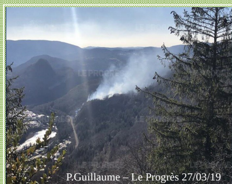
P.Guillaume - Le Progrès 27/03/19

60 ha de forêt sont partis en fumée suite à un feu mal maîtrisé sur la commune de Maisod 3