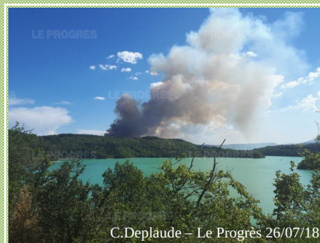
C.Deplaude - Le Progrès 26/07/18

➔ Combustibilité et inflammabilité en période de défoliation