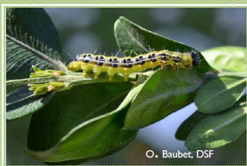
O. Baubet, DSF

Plusieurs milliers d'hectares de buis défoliés (= perte de feuilles) depuis 2017 dans le Jura