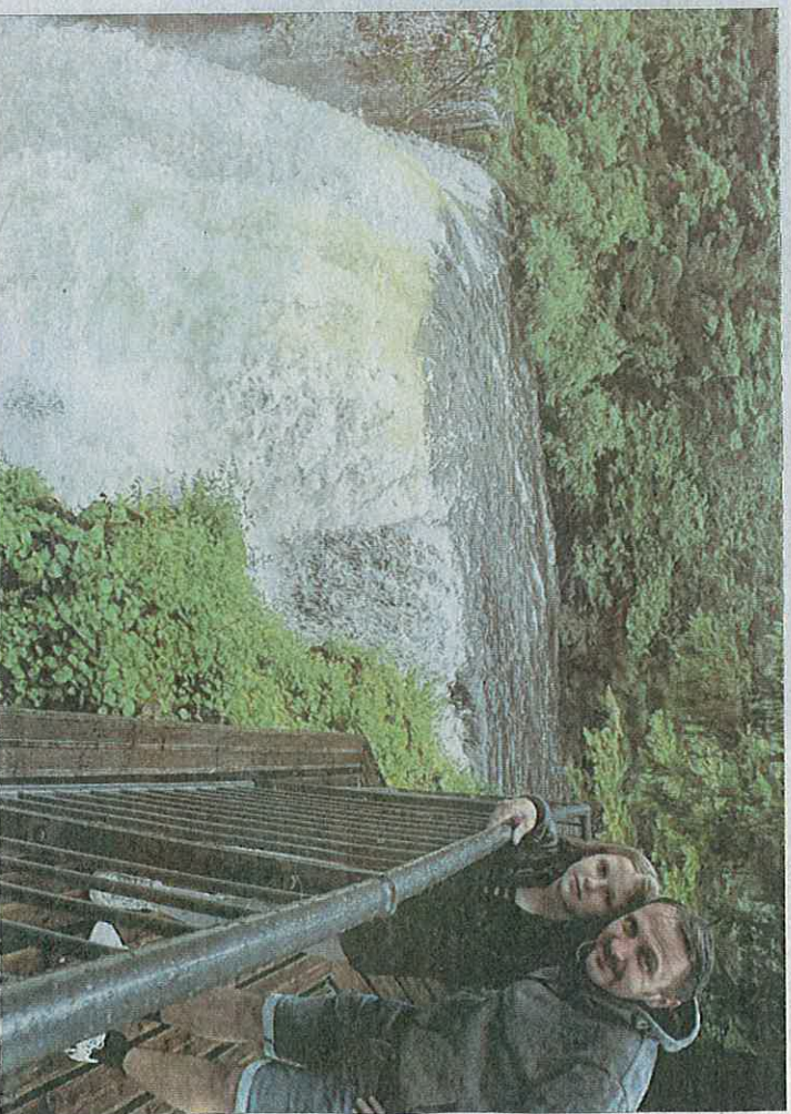
Le belvédère de la cascade du moulin du saut a été livré et ouvert au public le 7 juillet dernier.

Dans les aménagements notables déjà réalisés, on peut noter la création d'un belvédère surplombant la source de l'Ain, ainsi que l'extension d'un autre existant, du côté du saut des Maillys. Entre le moulin du saut et la source, des marches et des ponceaux ont été installés. Un parking a également été créé du côté Contre de la source de l'Ain, accompagné de barrières