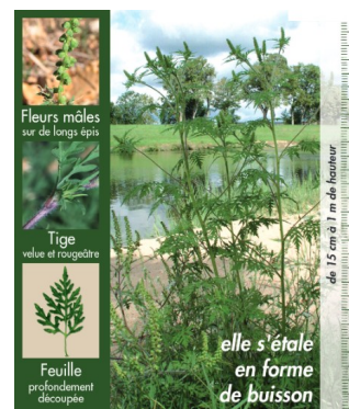
Etat des connaissances sur la répartition de l'ambrosie en Bourgogne Franche-Comté en janvier 2022

Toute personne qui identifie de l'ambrosie (cf. photo ci-contre) sur un terrain dont il a la propriété ou l'exploitation à l'obligation d'intervenir par sa destruction en utilisant le moyen approprié (arrachage, fauchage, utilisation d'un herbicide ...). Si le terrain n'est pas de votre propriété, ou que vous ne connaissez pas les propriétaires, vous pouvez en faire le signalement sur la plateforme : www.signalement-ambrosie.atlassante.fr ou auprès du référent communal.