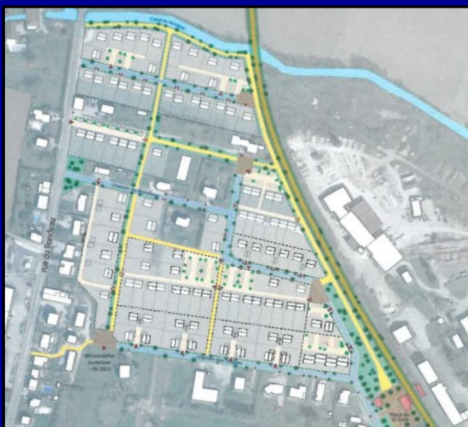
Aménagement de l'écoquartier de Bletterans – BE « Urbicand »