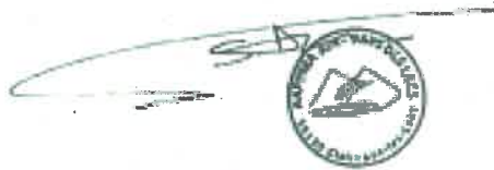
Ain-Pays des Lacs

Nous vous remercions de votre engagement à entretenir la bonne entente entre usagers de nos milieux aquatiques afin de faire perdurer puis développer les parcours de la pêche de la carpe de nuit.