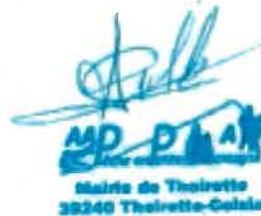
Pêche en Petite Montagne

AAPPMA LA GAULE DU BAS JURA 1, rue de Citeaux - 39100 DOLE Président