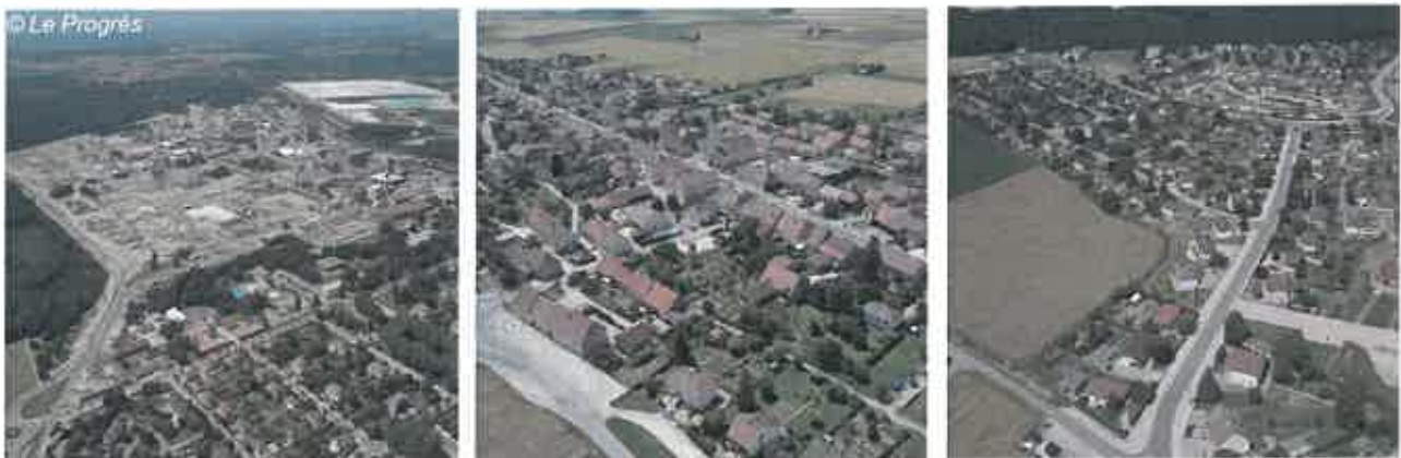
Vues aériennes de la commune de Tavaux : L'usine Solvay / Le vieux village / La Mulotte

Les communes font partie de la communauté d'agglomération du Grand Dole. Elles disposent d'un PLU approuvé. Elles sont intégrées dans le périmètre du SCoT du Grand Dole lancé en 2004 mais non approuvé à ce jour (suspendu depuis 2012).