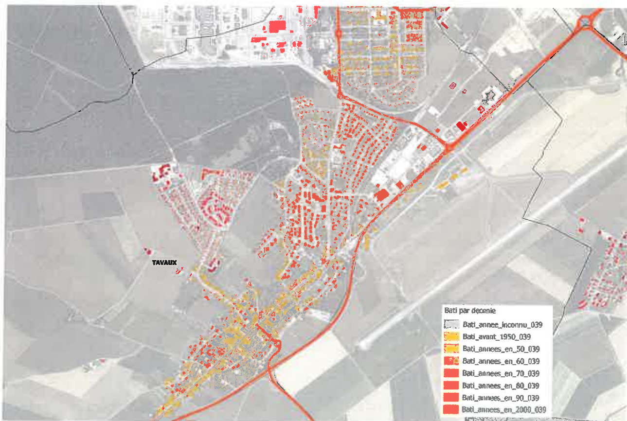
Evolution de la morphologie urbaine de la commune de Tavaux entre 1950 et 2008. Analyse des fichiers fonciers MAJIC / DDT 39.

Extrait de l'Atlas des paysages de Franche-Comté. Tome 2 : Jura CAUE du Jura ; Laboratoire Théma ; Société Unisfère. Besançon : Néo-Éditions, 2000.- 381 p. ISBN 2-9515785-6-3